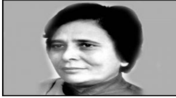
Kumudben Joshi (Former Andhra Pradesh Governor)